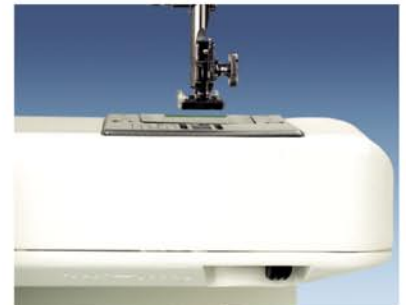
6. Możliwość podłączenia ząbków transportu.