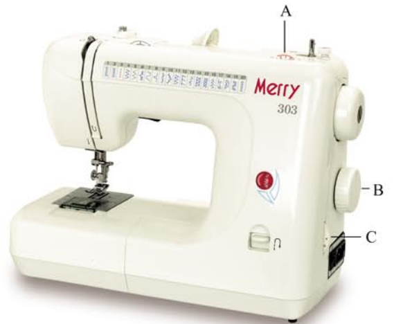
A - płynna regulacja szerokości zygzag od 0-6mm