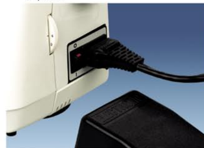
8. Elektroniczny regulator obrotów - płynna praca.