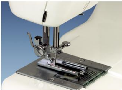
4. Obszywanie dziurek w dwóch pozycjach ustawienia maszyny.