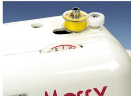
3. Automatyczne nawijanie nici na szpulkę.