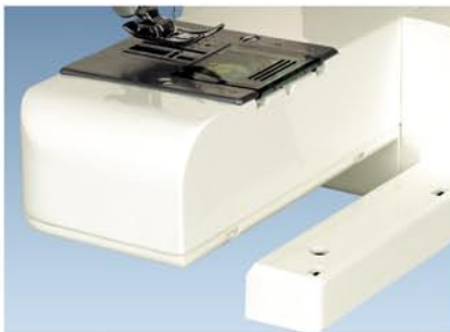
7. Zdejmowany stolik - można szyc na okrągło.