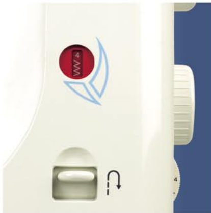
1. Dzwignia cofania ściegu, ryglowanie podczas pracy.

Nowoczesna wieloczynnościowa maszyna domowa do szycia