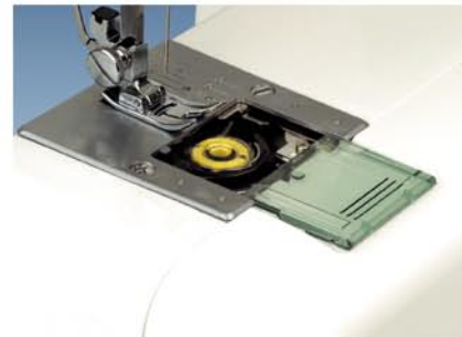
5. Chwytnacz rotacyjny ułożony poziomo - łatwe wyjmowanie szpulki.