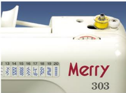
2. Szpulka nici ułożona poziomo.